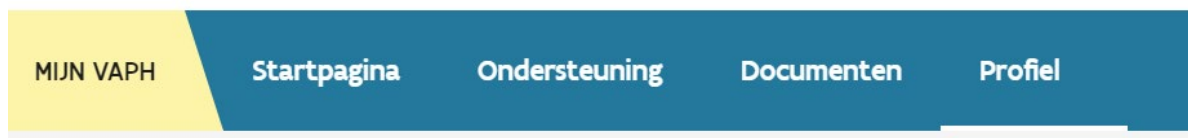
Menu: oude lay-out

Bovenaan de pagina ziet u vanaf 2 september enkel nog uw naam en dossiernummer. Als u daarop klikt, ziet u alle rubrieken (dashboard/startpagina, persoonlijk budget, ondersteuning, documenten en profiel).